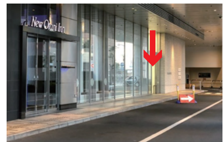
1階エントランス外観

ホテルニューオータニインの入口を通り過ぎた左手にオフィスエントランスの入口がございますので、お入りいただきエレベーターにて13階にお上がりください。